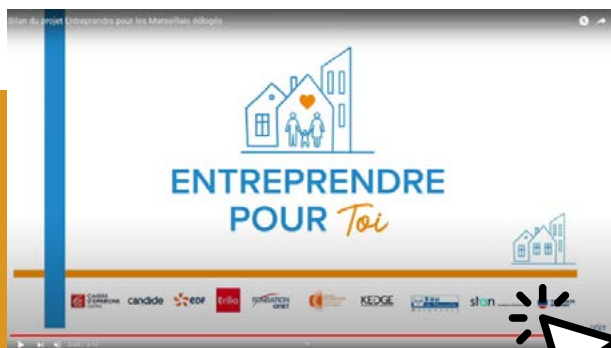
Vidéo bilan du projet

Entreprendre pour toi a pour objectif de soutenir les actions des associations en permettant aux entreprises et à leurs collaborateurs de mettre en commun leurs ressources financières, humaines et matérielles pour créer une dynamique plus forte et avoir plus d'impact dans l'aide apportée aux personnes les plus vulnérables.